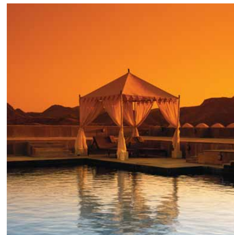
Traitements spa près de la piscine

Das einwöchige Wohlfühl-Paket „Safar“, das Sie von morgens bis abends mit ausgewählten Mahlzeiten und Aktivitäten anleitet, stellt ein umfassendes Entgiftungsprogramm dar. Um Ihre Energien zu erneuern und zu innerem Frieden zu gelangen, bedarf es einer Umgebung vollkommener Harmonie. Erleben Sie Yoga (Kontrolle über Körper, Atmung und Geist) und Dhyana (Meditation) bei Sonnenaufgang auf den Wällen des Palast. Genießen Sie Aromabäder ganz privat in Ihrem Zimmer.