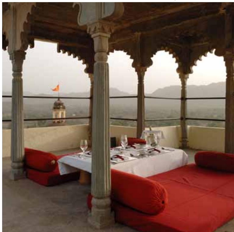
Ein Ort für Ihr privates Abendessen

Ein privates Abendessen an einem ganz besonderen Ort, untermalt mit einer leisen Flötenmelodie, die über monderleuchtete Berge hinwegklingt, wird Ihnen noch lange in Erinnerung bleiben.