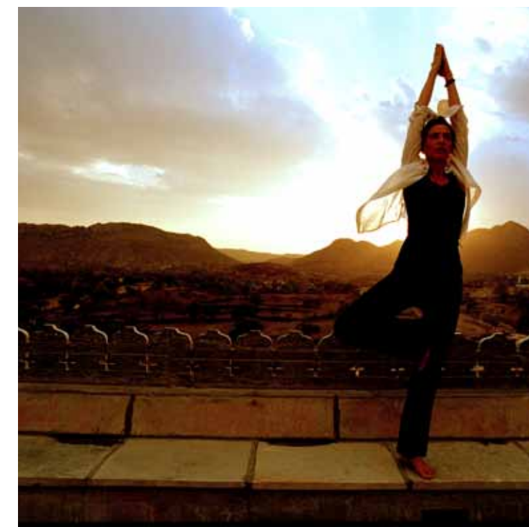
Yoga auf der Dachterasse

Die landschaftliche Schönheit der umliegenden Aravali Hügel kann am Besten auf einer Wanderung, einer Fahrradtour, einer Kamelsafari oder bei einem Ausritt zu Pferd genossen werden. Für alle, die bereits frühmorgens aufbrechen möchten, bieten wir gerne Lunchpakete an. Um etwas mehr über die Geschichte der Region zu erfahren, laden wir Sie herzlich zu einer geführten Tour durch die Palastfestungen ein. Auch arrangieren wir gerne einen Ausflug ins hübsche Dorf Delwara, in den nahegelegenen Jaintempel aus dem 14. Jahrhundert oder ins pittoreske Udaipur mit seinen Seen und Palästen. Sie können nicht nur auf den Märkten Udaipurs shoppen gehen, sondern auch exklusive handgefertigte indische Produkte im Devi Design Shop finden.